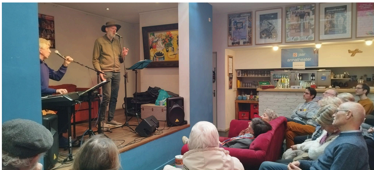
Sfeerimpressie Gluren bij de Buren 2025

In 2025 deden we voor de eerste keer (sinds lange tijd) weer mee met Gluren bij de Buren. We ontvingen twee artiesten: een koor en een kleinkunst duo. We ontvingen 165 bezoekers verdeeld over 6 voorstellingen. Alle voorstellingen waren goed bezocht en gevoelsmatig vol.